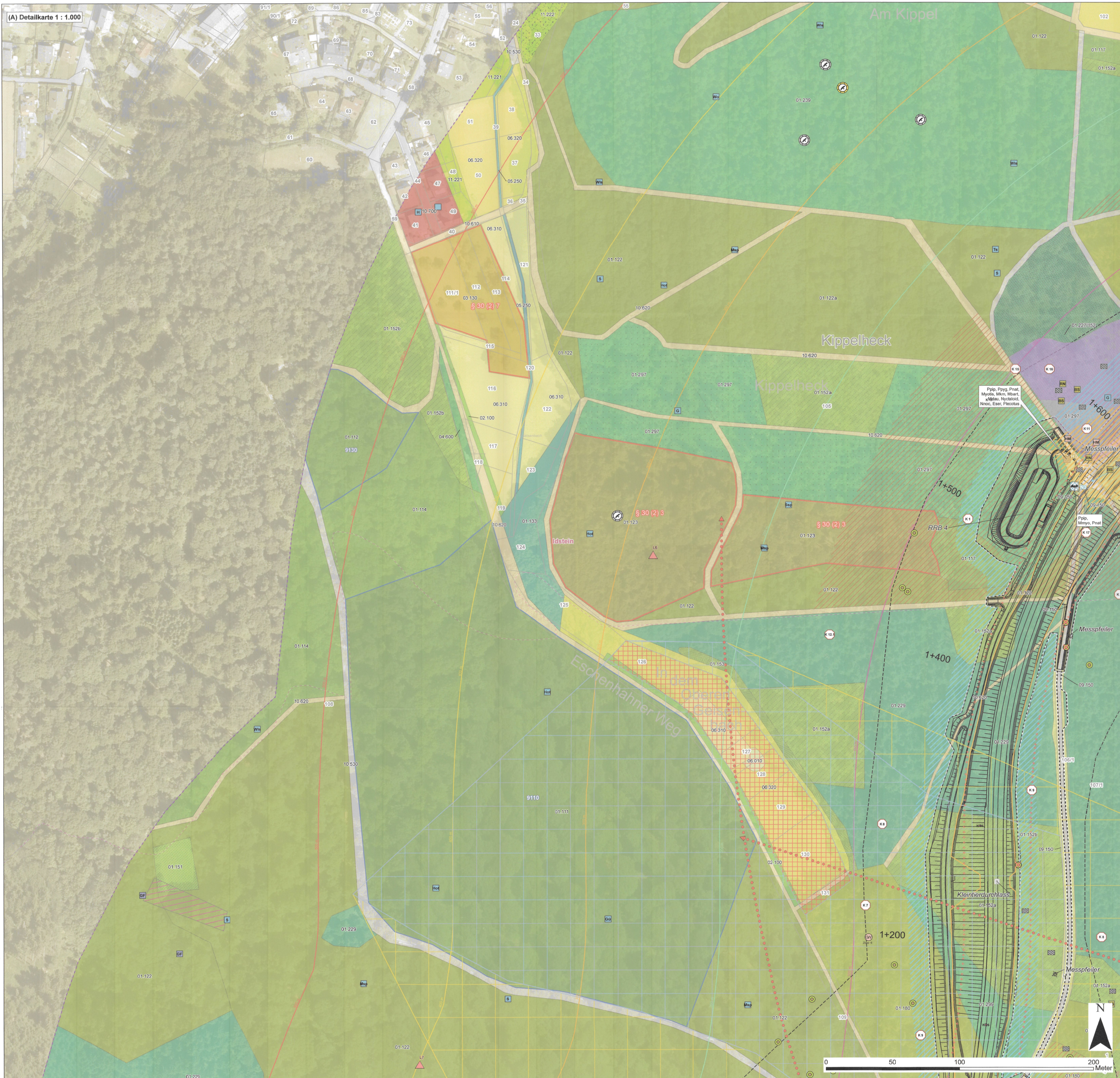
(A) Detailkarte 1 : 1.000